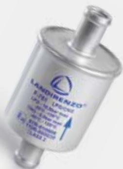
Схема подключения LANDIRENZO EVO

Устанавливаемый между редуктором и форсунками фильтр паровой фазы выполняет тонкую очистку топлива. Благодаря внутреннему картриджу фильтр улавливает примеси до 10 мкм, что значительно увеличивает срок службы форсунок.